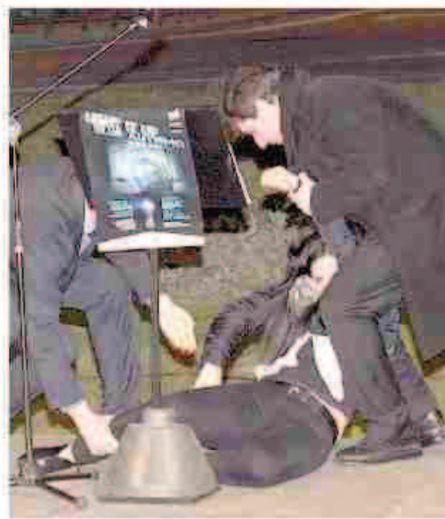
I primi soccorsi a Emily Rini svenuta

È stata dimessa ieri nel primo pomeriggio, dopo un breve ricovero precauzionale in Medicina d'urgenza all'ospedale di Aosta, l'assessore regionale all'Istruzione e Cultura Emily Rini, che ha avuto un malore giovedì sera, poco dopo le 21, durante la cerimonia per l'accensione di blu dell'Arco d'Augusto di Aosta. I medici spiegano che Rini ha avuto una «perdita di coscienza dovuta a un probabile calo di pressione». L'assessore stava tenendo il suo breve discorso in occasione della Giornata mondiale della consapevolezza dell'autismo con la prima accensione in blu dell'Arco, che resterà illuminata fino al 30 aprile, e all'im-