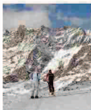
Si scia ancora in tutta la Valle

Regione Mutui prima casa arrivano 14 milioni Con uno stanziamento di 14 milioni la giunta regionale ha approvato il provvedimento che finanzia le ultime pratiche per chi nel 2014 aveva fatto richiesta di finanziamento per la prima casa o per il recupero di un immobile in centro storico. Camera PAGINA 43