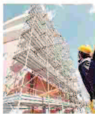
Operai in un cantiere

Regione Mutui prima casa arrivano 14 milioni Con uno stanziamento di 14 milioni la giunta regionale ha approvato il provvedimento che finanzia le ultime pratiche per chi nel 2014 aveva fatto richiesta di finanziamento per la prima casa o per il recupero di un immobile in centro storico. Camera PAGINA 43